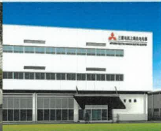
三菱电机上海机电电梯工厂