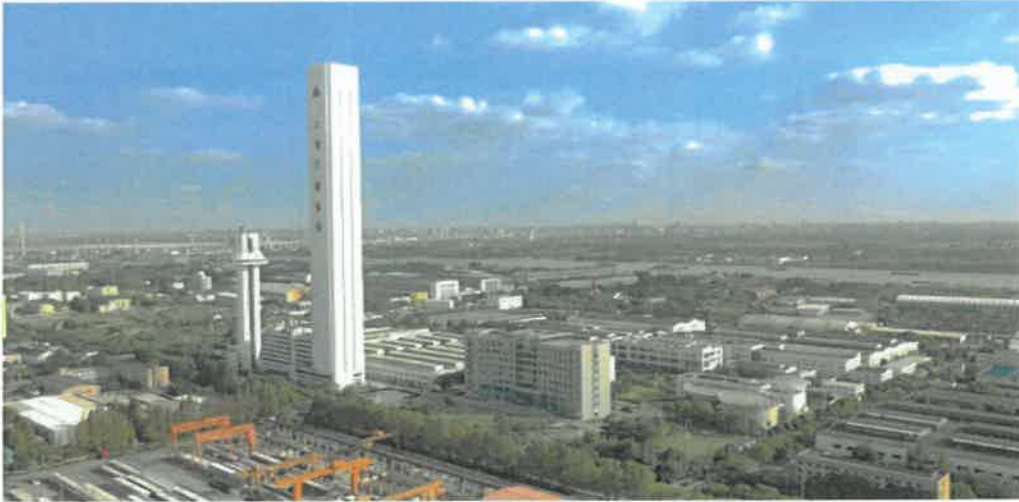
上海三菱电梯总部